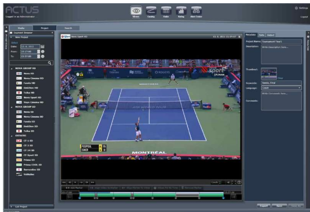
Actus Clip Factory: Des clips à segments multiples, des métadonnées